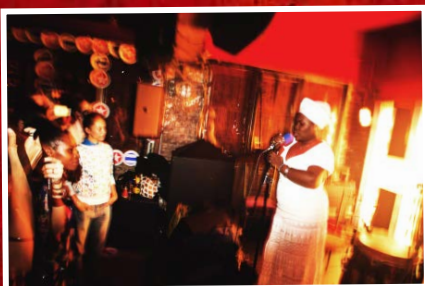
Daymé Arocena en vivo en Londres, 2014

Cada uno de los productores musicales fue posteriormente invitado a La Habana, donde participaron en cuatro días de sesiones de estudio intensivas para grabar instrumentos y voces en vivo para sus pistas. El álbum 'Havana Cultura Mix' se lanzó en colaboración con el sello discográfico Brownswood en octubre de 2014.