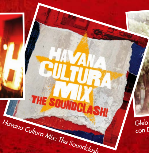
Havana Cultura Mix: The Soundclash