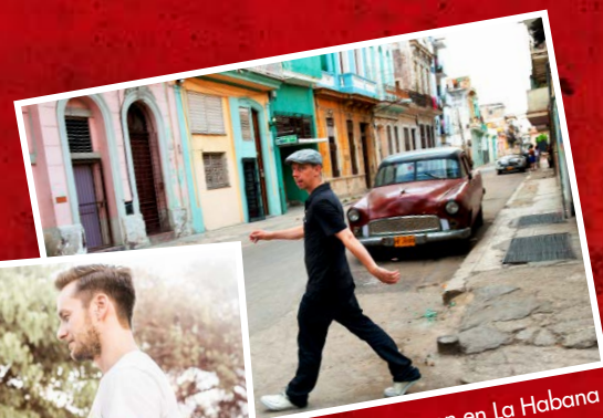
Gilles Peterson en La Habana